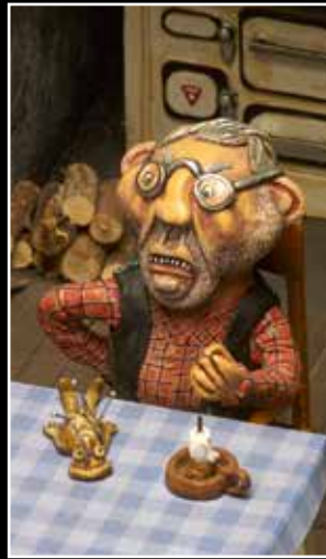
L'enclouage de la poupée.