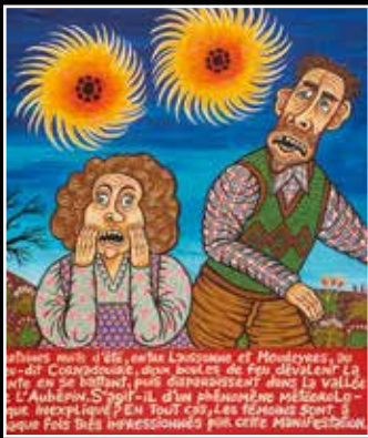
Les boules de feu dans le ciel