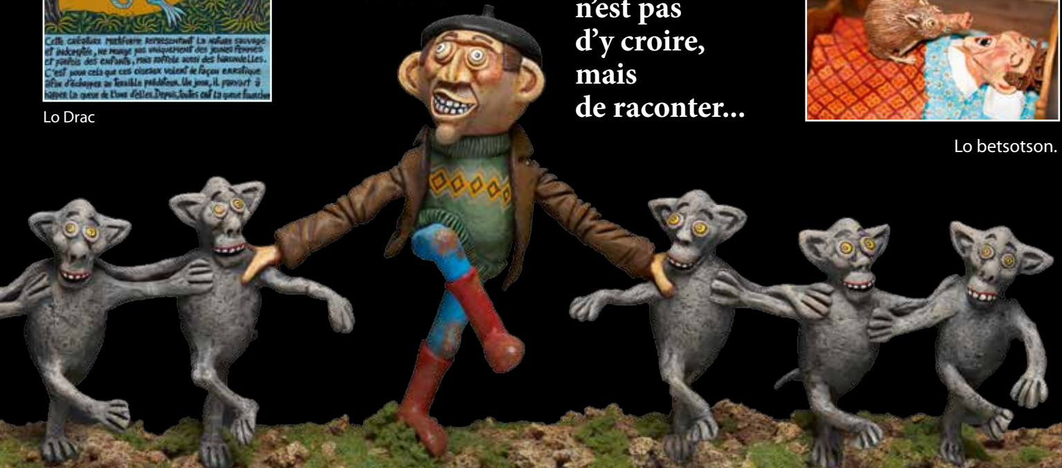
Le bossu malavisé du Breuil.